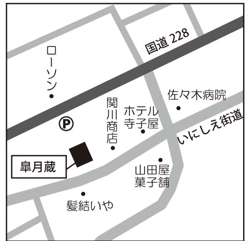
□グルメ交流・ヒバ展会場案内図 名称：臯月蔵 住所：江差町姥神町 18-1